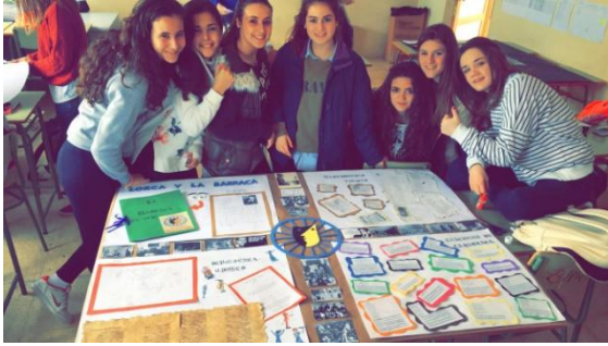
Panel informativo: Lorca y la Barraca.

La Barraca es para mí toda mi obra, la obra que me interesa, que me ilusiona más todavía que mi obra literaria, como que por ella muchas veces he dejado de escribir un verso o de concluir una pieza, para lanzarme por tierras de España en una de esas estupendas excursiones de mi teatro.