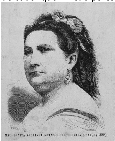
MAD. BENITA ANGUINET, NOTABLE PRESTIDIGITADORA (pág. 399).

El miércoles 13 (menos mal que no era martes) empecé el tratamiento preventivo recetado por los oncólogos. La primera sesión de radioterapia (de las 30 recetadas), que recibiré de lunes a viernes (descanso los fines de semana y festivos) y una pastilla de Temodal 140 mg (quimio) que tendré que tomar a diario, sin descanso. De momento, bien, siguiendo las pautas que el equipo de enfermería me ha recomendado, no siento síntomas que me alteren, más allá de saber que mi cuerpo está recibiendo algo extraño, pero bien y ojalá siga así durante todo el tratamiento y pueda seguir escribiendo como ha sido con este que ahora vez la luz.