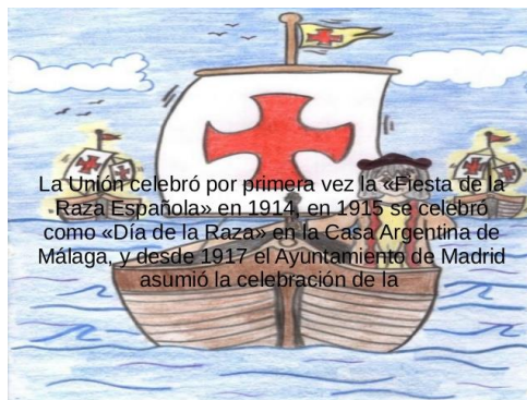
La Unión celebró por primera vez la «Fiesta de la Raza Española» en 1914, en 1915 se celebró como «Día de la Raza» en la Casa Argentina de Málaga, y desde 1917 el Ayuntamiento de Madrid asumió la celebración de la

En 1914 se celebra el 12 de octubre por primera vez como fiesta de la Raza. En 1915 pasa a llamarse Día de la Raza: La Unión celebró por primera vez la « Fiesta de la Raza Española » en 1914 y en 1915 se celebró como « Día de la Raza » en la Casa Argentina de Málaga, y desde 1917 el Ayuntamiento de Madrid asumió la celebración de la « Fiesta de la Raza » en la capital de España. Se transforma en fiesta nacional por ley de Alfonso XIII del 15 de junio de 1918. El nombre Día de la Hispanidad –y el propio vocablo hispanidad– fue propuesto a fines de los años 20 por Mons. Sacarías de Vizcarra (sacerdote español, residente en Buenos Aires) al periodista Ramiro de Maeztu (por entonces, embajador de España en Buenos Aires), ya que consideraba «poco feliz y algo impropia» la denominación Día de la Raza. El nuevo nombre fue paulatinamente reemplazando al antiguo en España (no así en América), hasta que el 10 de enero de 1958, es oficializado por decreto de la Presidencia del Gobierno.